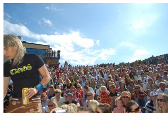
Här syns några av våra fans