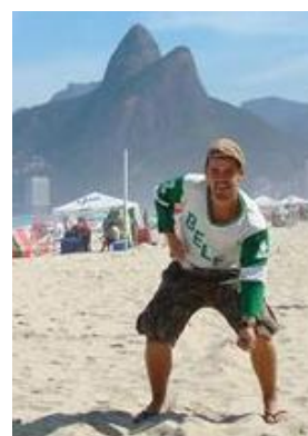
Roos promotar Bele en liten bit sydväst om Stockholm